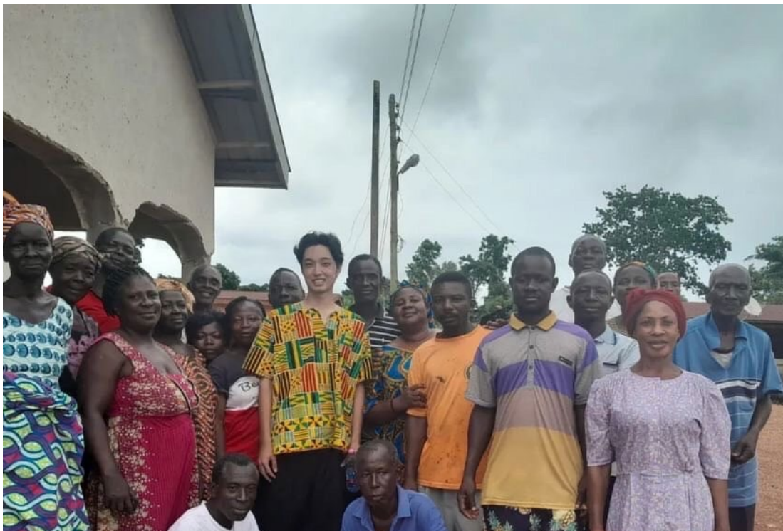
カカオ農家に1週間ホームステイし、フィールド調査を行った様子。（写真中央 黄色の服）

アフリカへ飛び出そうとしている方が一歩を踏み出せるようにサポートしていきたい。日本人の多くは、アフリカに対して病気や犯罪などのマイナスのイメージを持っており、アフリカに行くのをためらってしまう。私はガーナへ行き、病気や犯罪に巻き込まれないようにする方法を学んできた。この知識を大学や地域のアフリカへ踏み出すことを躊躇している方達に伝え、その方がいずれグローバル人材となり地域に貢献できるようにサポートしていきたい。