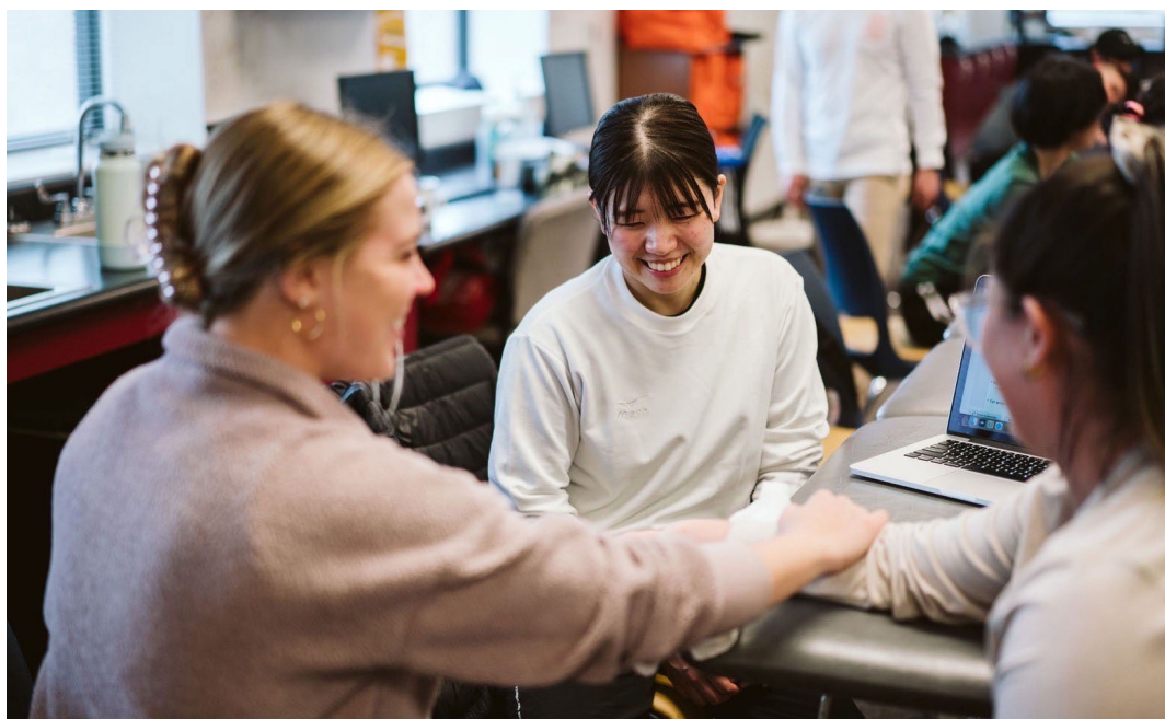
レジス大学で生徒と一緒に授業を受けました。（真ん中の白い服）

この学びを活かして、部活動や授業等で怪我をしたとき、トレーナー等の救急対応できる存在を各学校に配置できるようなシステムを作りたい。教師がトレーナーの資格を持つ・勉強することで、怪我した生徒の競技復帰を早めることができ、生徒が安心して活動に取り組むことができると考える。留学の成果を、栃木県民の健康づくりの底上げに活かしたい。