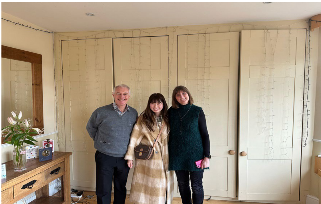
両端の方がティーパーティに招待してくださったご夫婦

将来は地域に貢献できる公務員になりたいと考えている。今回の留学で日本との相違点を多く発見できた。街並みにはゴミ箱が至る所に置いてあったり、支払いがカード払いのみで電子化が進んでいた。また、マイボトルを持参していることから環境問題への意識も感じられた。あまり見かけることがないものばかりで、日本ではゴミが出た場合は家に持ち帰る必要があり不便に感じることもある。公務員になり職務に全うし栃木県民にとって住みやすいまちづくりに携わっていきたい。