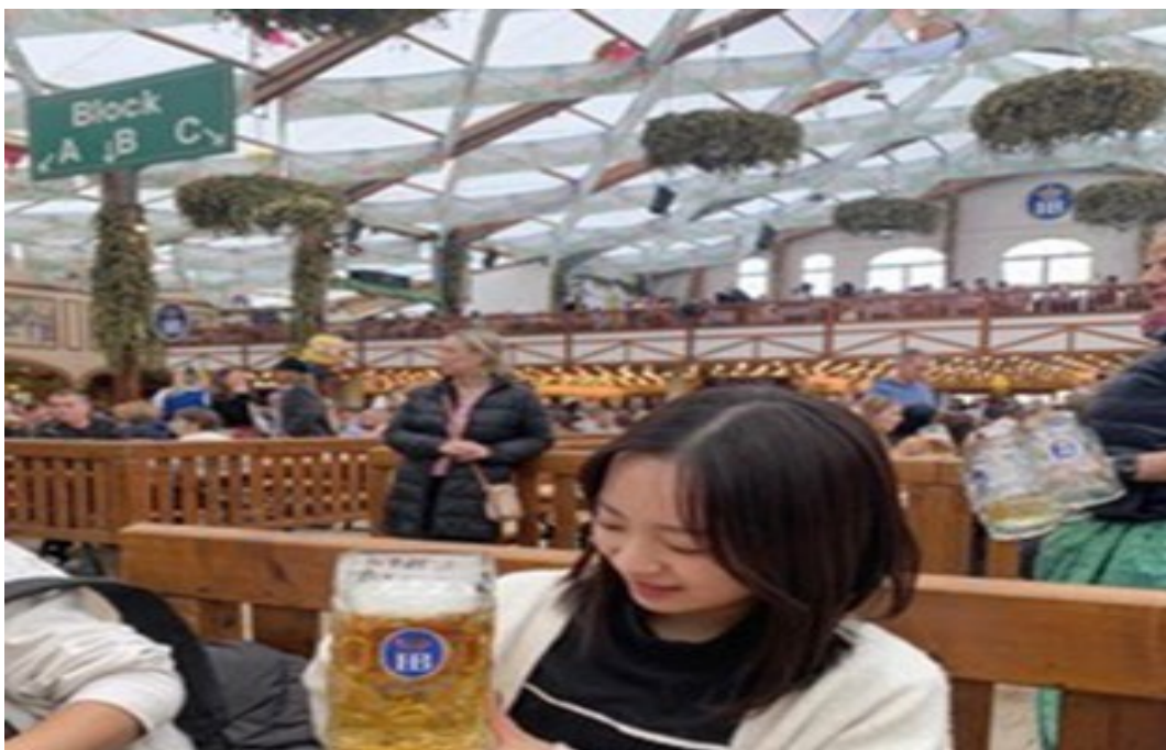
ミュンヘンのオクトーバーフェストを訪れた時の様子

留学中は環境に配慮した取り組みを知り、体験する機会を得ることができました。特に、資源の循環を促すフリーマーケットやコンポスト、街の緑化やオーガニック農園などの取り組み、気候変動のデモなどは貴重な学びの機会となりました。栃木県でもNPO法人うつのみや環境行動フォーラムや那須塩原市、宇都宮市環境保全課などで環境に配慮した活動が活発です。私がゼミの活動を通して取り組んでいるUU3Sで、これらの団体と協働しながら、ドイツの事例を参考に新しいアイデアを反映していきたいです。