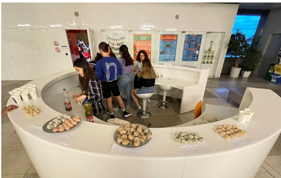
国別プレゼンテーションの日本の発表で振る舞ったおにぎり

前述したように、留学を経た現在は、より多くの国際交流の機会を設けたいと計画している。まずは宇都宮大学内の交流の場を増やしたいと考えており、自身が大学内の国際交流の場に参加するのみならず、イベントを企画することも目標としている。今学期には、大学の留学生チューター制度を利用し、担当留学生の在学中のサポートをすることが決定しているので、個人という範囲でも学内の学生団体という範囲でも国際交流を活発化させる役割を担えるよう努め、徐々に学外の地域にも国際的な交流機会を広めていきたい。