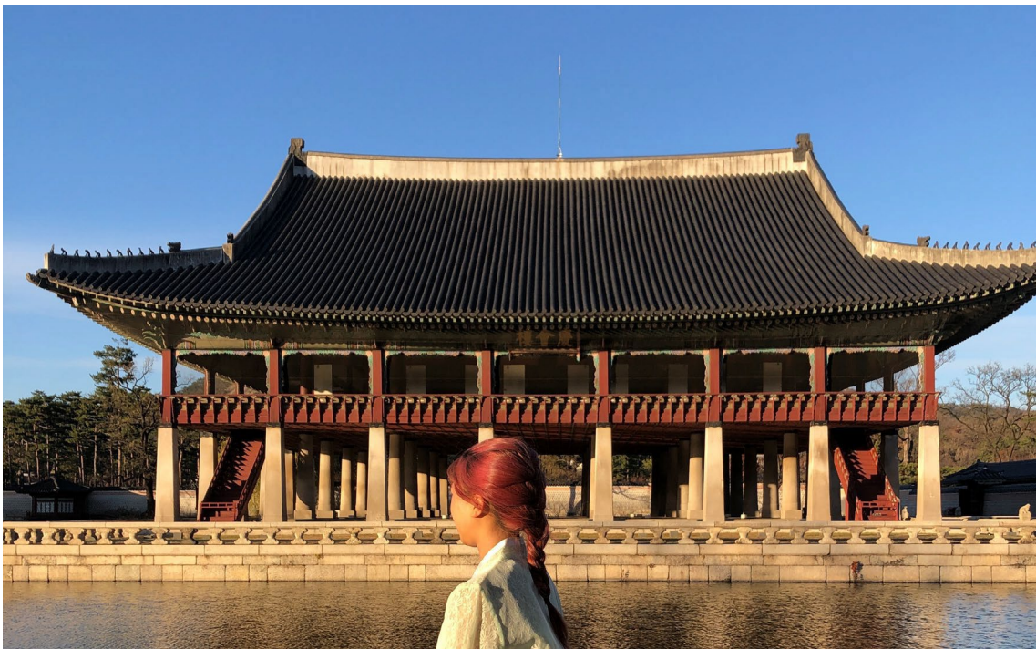
韓国の友人と景福宮を訪れた際の写真

私は留学生活中、現地学生に韓国生活をサポートしてもらえる制度を利用していたのですが、留学前に私自身もチューター活動でサポートする側を務めていました。サポートされる側になって見えた改善点もあったため、今後はその経験を生かして引き続き、宇都宮大学に留学に来る世界各国の留学生が心配なく勉学に励むことができるサポートをしたいと考えています。私のサポートが留学生にとって、いつか栃木県ではたらきたいと思ってもらえるきっかけになったらいいなと思っています。