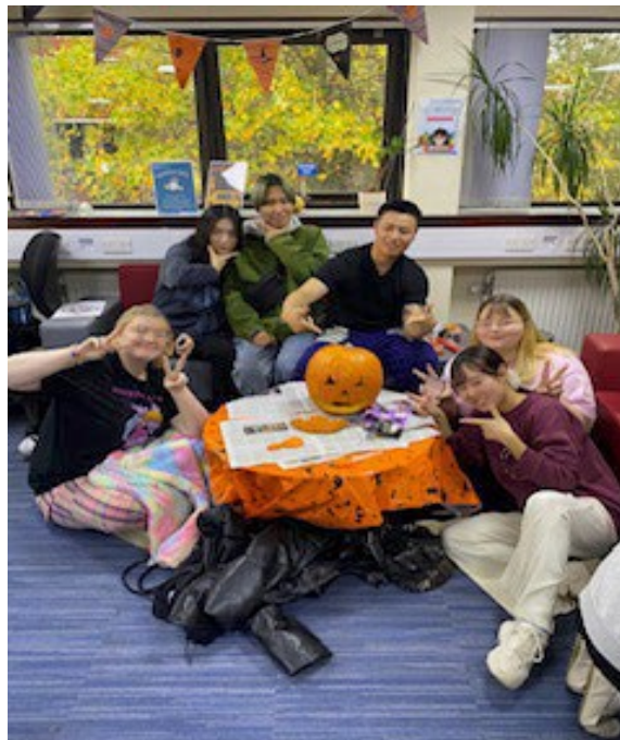
大学のイベント（ハロウィン）でパンプキン作成しました（右下。赤い服）

私は上記の留学の成果を、外国籍の人が偏見や差別がなく平等に扱われ、全ての人交流しながら生活できる地域作りに役立てたい。私が留学していたプレストンは、大学が多くの留学生を受け入れているから多国籍地域として成り立っていた。しかし、差別はほとんどなく、全人種の人が交流し理解し合える環境だった。私は栃木をそのような環境にするために、国際協力サークルとしての活動に力を入れたい。多くの文化を紹介して理解力を上げることによって、自然と多文化を受け入れ共存出来る地域作りに繋がると思う。