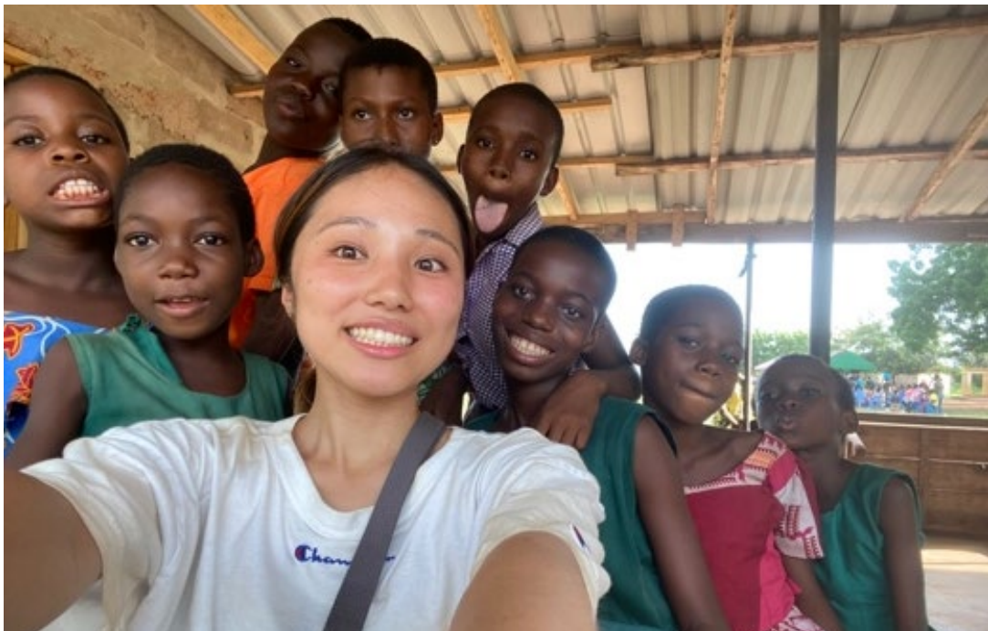
ガーナボルタ州、JICA協力隊任地を見学した時の様子（中央）

この貴重な留学経験を、地域の人々、特に私と同じように留学を希望する学生に伝えたい。私は留学するまで一人暮らしをしたことがなく、留学に非常に不安があった。だが、留学に行った先輩たちや海外勤務を経験したことのある方々から話を聞くことで後押しされ、留学を決意することができた。実際、すでに自分の大学ではワークショップを開いて後輩に留学の魅力を伝えたり、留学生と共にアフリカに少しでも興味を持ってもらえるよう大学祭に向けて準備したりしているため、これからもこのような活動を続けていきたい。