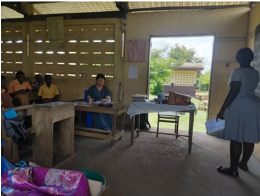
地方の学校に足を運び、卒業論文の調査（授業観察）を行っている。（写真中央）

留学を通して、全く知らない土地に滞在する時には言語面も含め、様々な不安があることを体感しました。地域にいる外国人に対して、言語の面で分からないことがあったら英語でサポートしたり、文化や生活の面では、相手の文化的背景を否定しないように日本の習慣やルールを説明したりするなど、地域社会に少しでも馴染むようなサポートをしていきたいと考えています。