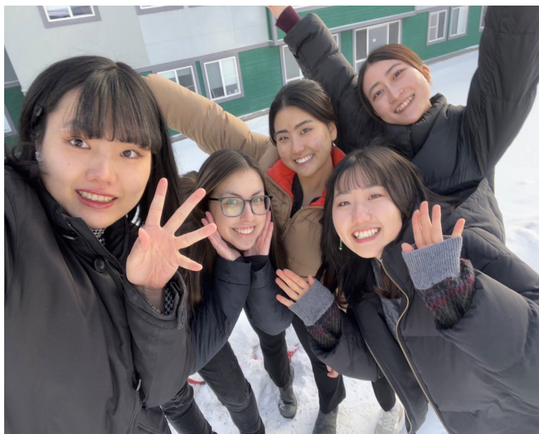
学生寮前で撮影した、ルームメイトとの写真です（左）

私は留学の成果を、宇都宮大学という組織内にある機会を通し、自信が留学で得た学びや経験、視点、そして英語力を活かしながら多くの人に伝え、活かしていきたいです。大学内におけるサークルや留学生のサポート組織などを通じて、地域全体の社会の国際化に少しでも貢献していければと考えています。コロナ禍での留学は現在留学を志す地域の大学生にとっても有益な情報であると考えため、可能な限りニューノーマルの社会における留学経験を継承し、今後留学を行いたい方に有意義な情報を残していきたいと考えます。